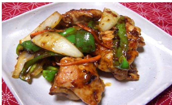
栄養成分表 (1人前あたりの含有量)